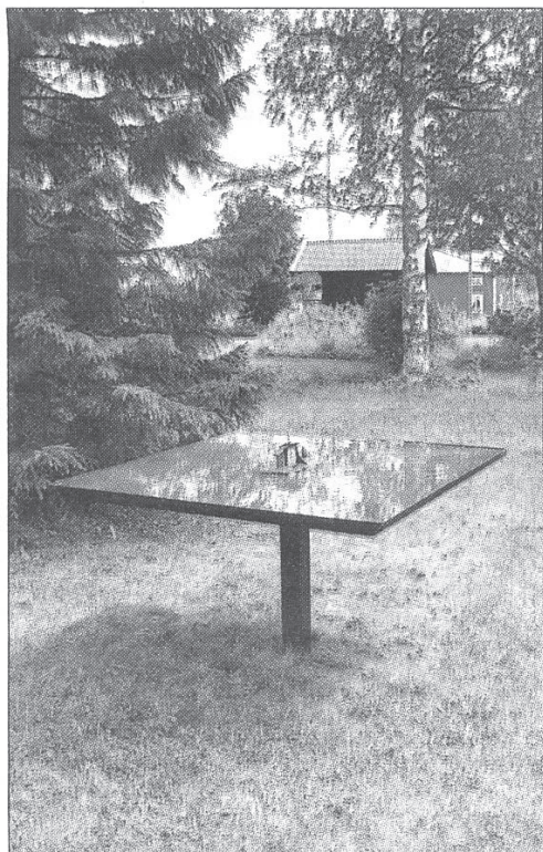
Spegling av Rune Rydelius.