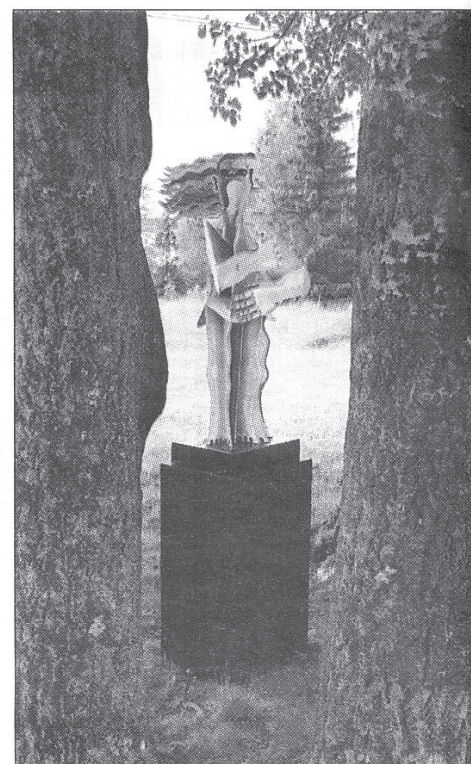
Timo Solins "Kvinna" trivs bland asparna.