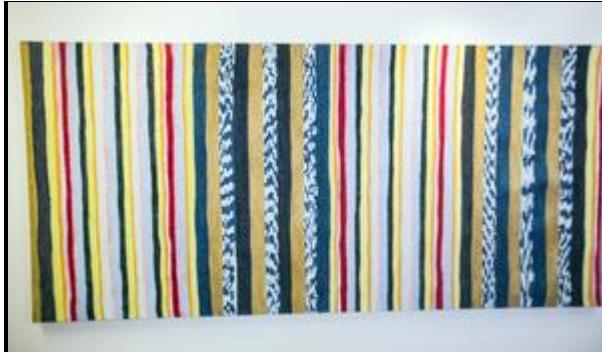
Verk av Anna Renström.