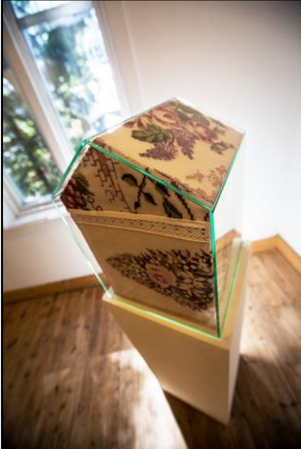
Verk av Birgitta Nenzén. Bild: Katarina Östholm