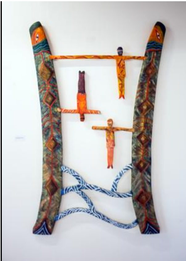
Verk av Dag Wallin.